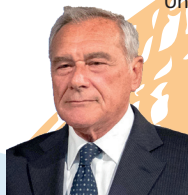
Sen. Piero Grasso